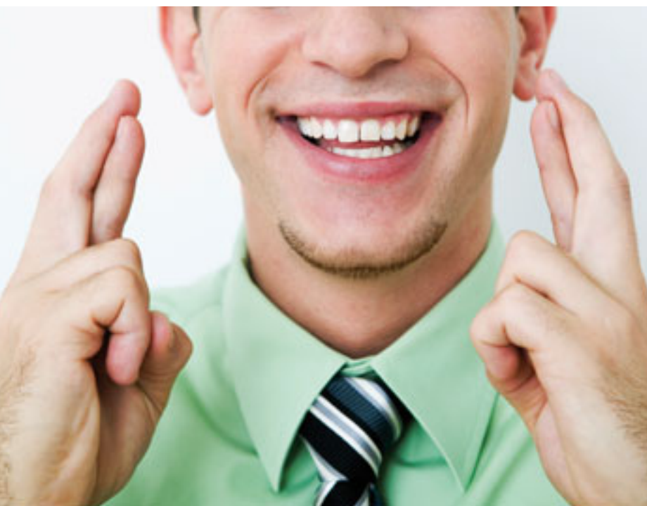
En la imagen de la fotografía probablemente el que cruza los dedos no es el candidato, sino uno de nosotros.

En 2003, la Unión Europea decidió apostar por esta idea, con el fin de incrementar la competitividad de las empresas y subvencionó la implantación del Instituto en los 15 países que en aquel momento formaban la Unión. Hoy está presente en 30 países en los que se llevan a cabo los procesos de Análisis-Evaluación-Certificación para elaborar las Listas Best Workplaces siguiendo la misma metodología, pero adaptándose a las necesidades locales de cada país.