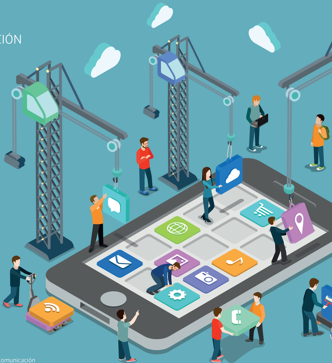
INMA SOLÍS, Responsable de Comunicación de iPhonedroid.